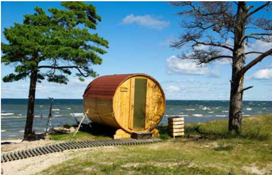
Letonia, Cabo Kolka. Mar Báltico

Merece la pena visitar el castillo de Riga, de estética contemporánea y residencia oficial del Gobierno como también la Iglesia de San Pedro, que cuenta con una torre desde la que podrás disfrutar de asombrosas vistas de la ciudad. También puedes entrar al museo de la ocupación, que narra la historia de la invasión nazi en 1941 de la república báltica y su posterior anexión por la Unión Soviética.