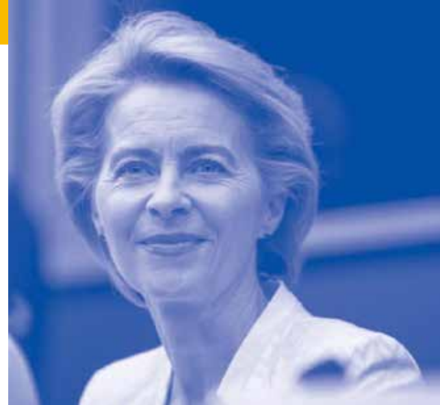
Presidenta de la Comisión Europea Ursula von der Leyen

10.-Ciberataques. La UE impone sus primeras sanciones a entidades y personas responsables de ciberataques en la UE